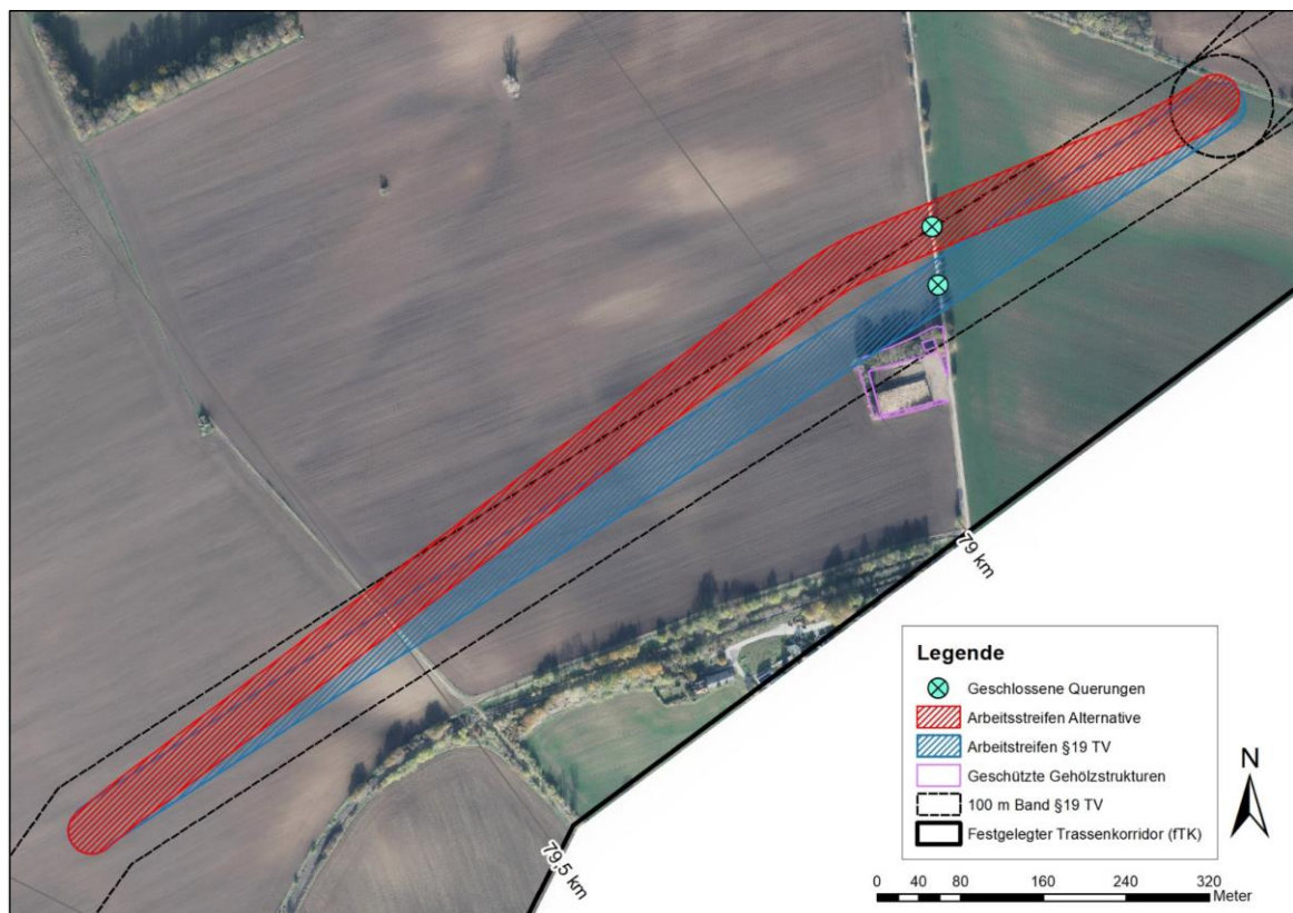
Abbildung 1: Übersicht des Alternativenvergleichs Alternative Krauschwitz